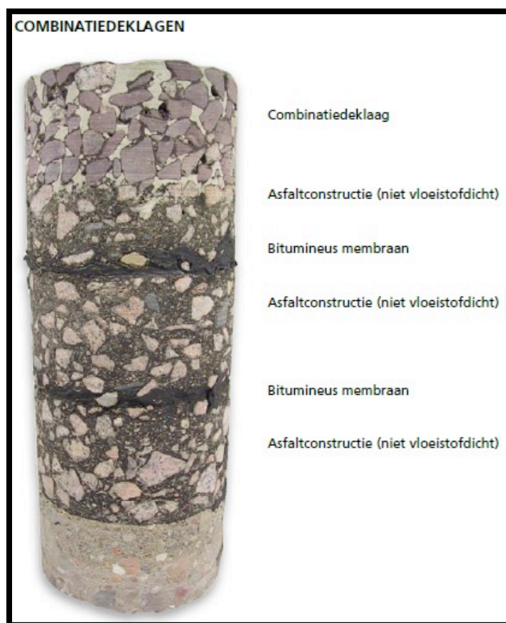
Foto: Voorbeeld van de opbouw van een combinatiedeklaag.