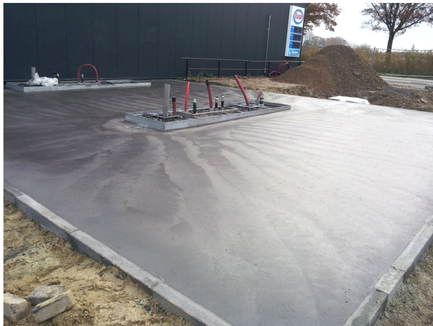
Foto: Aanleg van vloeistofdichte betonvloer.