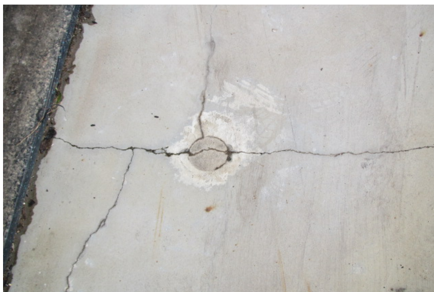
Foto: Voorbeeld van scheur.

De DI beschrijft scheuren en/of breuken en/of legt deze vast op een inspectietekening.