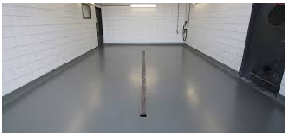
Foto: Voorbeeld kunstharsgebonden voorziening.