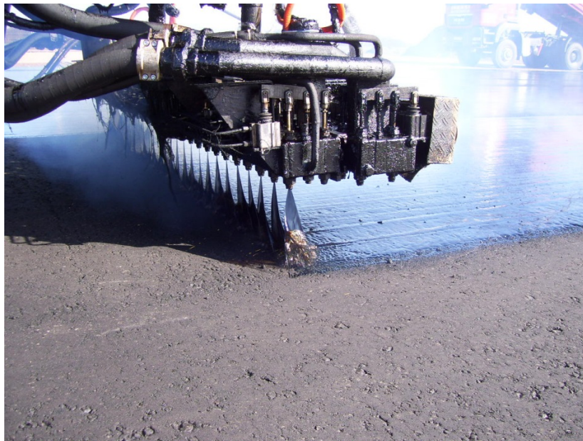
Foto: Aanleg vloeistofdichte asphaltconstructie.