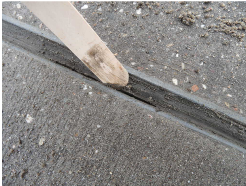
Foto: Afdichting is onthecht.