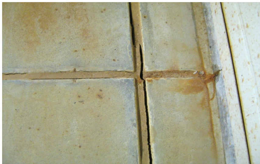
Foto: Beschadigde kitvoeg.

Een voegvullingsmassa of een afdichtingsprofiel kan gescheurd en/of beschadigd zijn. De DI merkt dit aan als een onvolkomenheid, tenzij de scheur of beschadiging over de volledige hoogte van de vulling of afdichting aanwezig is. Een scheur of beschadiging over de volledige hoogte van de vulling of afdichting is een gebrek.