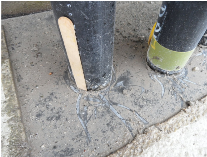
Foto: Voorbeeld van een niet-afgedichte doorvoer.

Bij doorvoeren in de voorziening beoordeelt de DI visueel of vloeistoffen langs of door de doorvoeren – eventueel voorzien van een afdichting met voegvullingsmassa of een pakking – de niet-belaste zijde bereiken of kunnen bereiken.