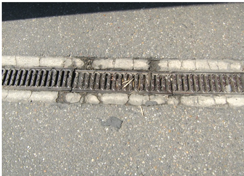
Foto: Aansluiting met lijngoot die niet vloeistofdicht is afgewerkt.

De DI kan ook door nader onderzoek de vloeistofdichtheid onderzoeken van lassen, (stort)naden en aansluitingen (zie hoofdstuk 4).