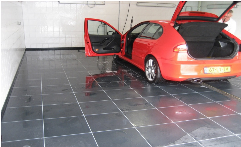
Foto: Vloer uitgevoerd met kunststof elementen.