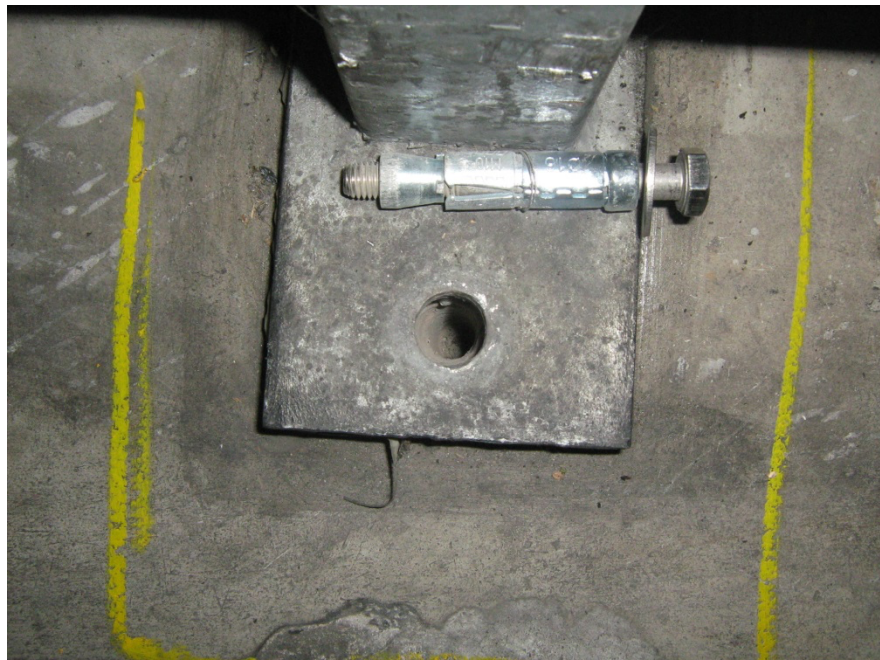
Foto: Voorbeeld van een niet juist afgedicht boorgat.

Hij kan zich daarvan overtuigen door steekproefsgewijs bij enkele boorgaten de diepte te bepalen. De steekproef mag als representatief voor de voorziening worden beschouwd, wanneer de DI bij de beoordeling van vijf opeenvolgende boorgaten die zich op kritieke plaatsen bevinden, constateert dat het boorgat tot een diepte van maximaal de helft van de dikte van de voorziening is aangebracht. Wanneer één of meer boorgaten dieper is aangebracht dan de helft van de dikte van de voorziening, dan moet de DI ervan uitgaan dat de bevestigingspunten niet vloeistofdicht zijn en hij merkt dit aan als gebrek.