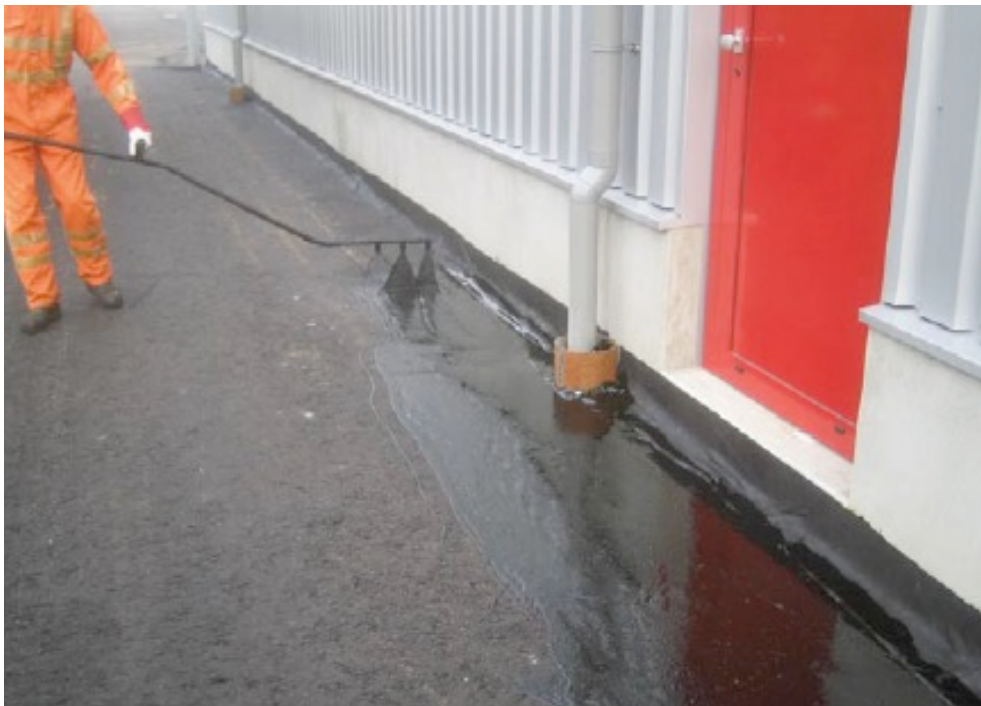
Foto: Voorbeeld kritieke plaats ter plaatse van aansluiting.