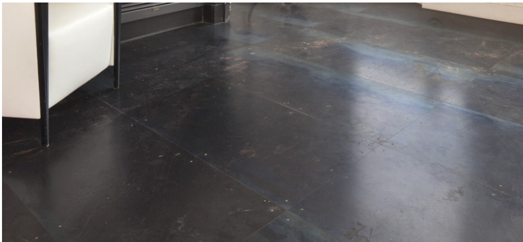
Foto: Voorziening van aan elkaar gelaste metaalplaten.