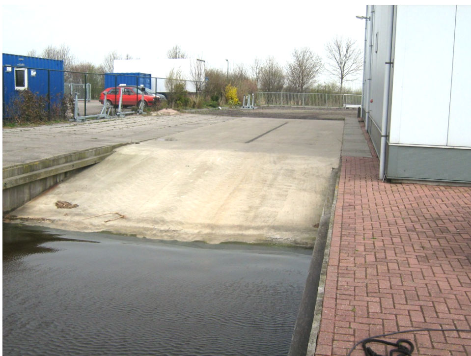
Foto: Voorbeeld van een aandachtspunt bij afschot richting oppervlaktewater.