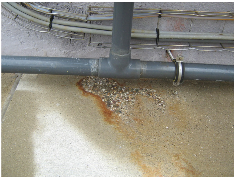
Foto: Voorbeeld van chemische aantasting.

Door kloppen of strijken met een hiervoor geschikt gereedschap kan de DI vaststellen of volledige hechting aanwezig is.